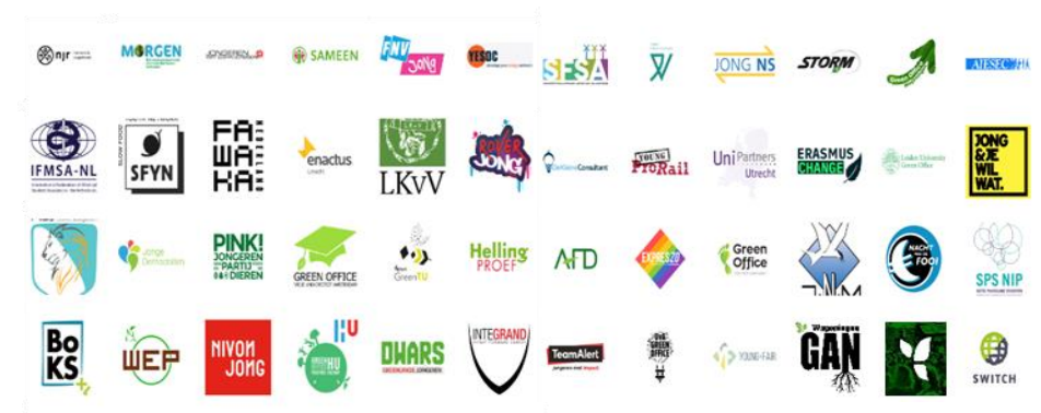
Afbeelding 1: Ondertekenaars van de Jonge Klimaatakkoord.

De Jonge Klimaatbeweging bouwt bruggen tussen jongeren en verenigt de visie op een duurzame toekomst van meer dan 100.000 jongeren verspreid over 72 jongerenorganisaties in de Jonge Klimaatakkoord. Op basis van deze agenda geeft de Jonge Klimaatbeweging u graag enkele bouwstenen mee voor uw partijprogramma voor de Tweede Kamerverkiezingen van 2021.