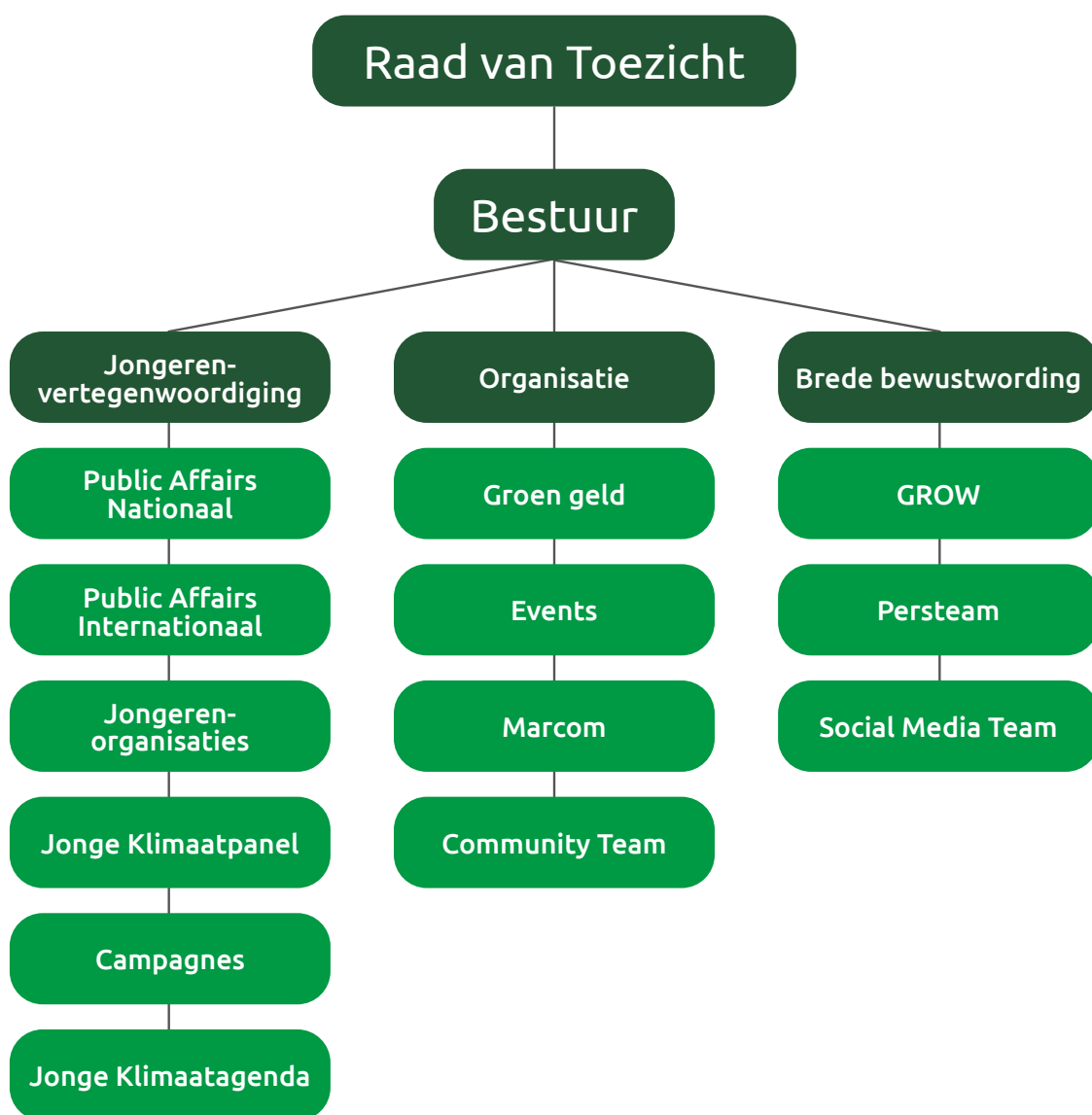
Afbeelding 1: Organogram van de Jonge Klimaatbeweging

nog kort uitgelicht en in verdere stukken uitgebreider. Boven de werkgroepen staat het bestuur van de JKB en daarboven de Raad van Toezicht.